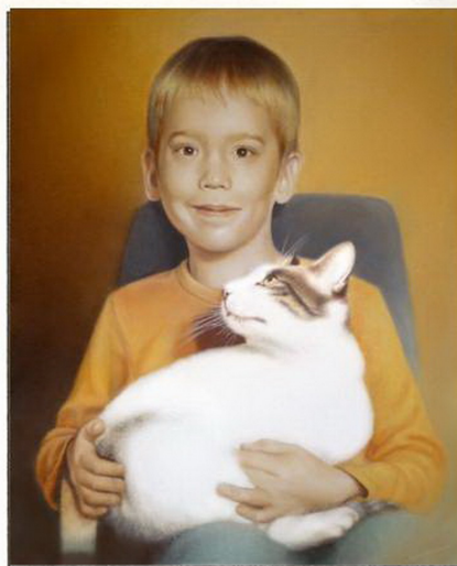
Realistický portret dieťaťa, olej na plátne, 2010

– Od detstva som veľmi rada sledovala ľudí, čo robia, ako sa majú a čo práve prežívajú. Oči veľmi veľa prezradia. Ak boli smutné, želala som si ich potešiť, ak boli šťastné, tešila som sa s nimi, ak prežívali bolesť, želala som si nájsť v tých očiach aspoň malú iskričku nádeje, ktorú som túžila zachytiť práve na portrétoch. Veľmi rada zachytávam vo svojej tvorbe ľudí alebo tváre. V portrétoch